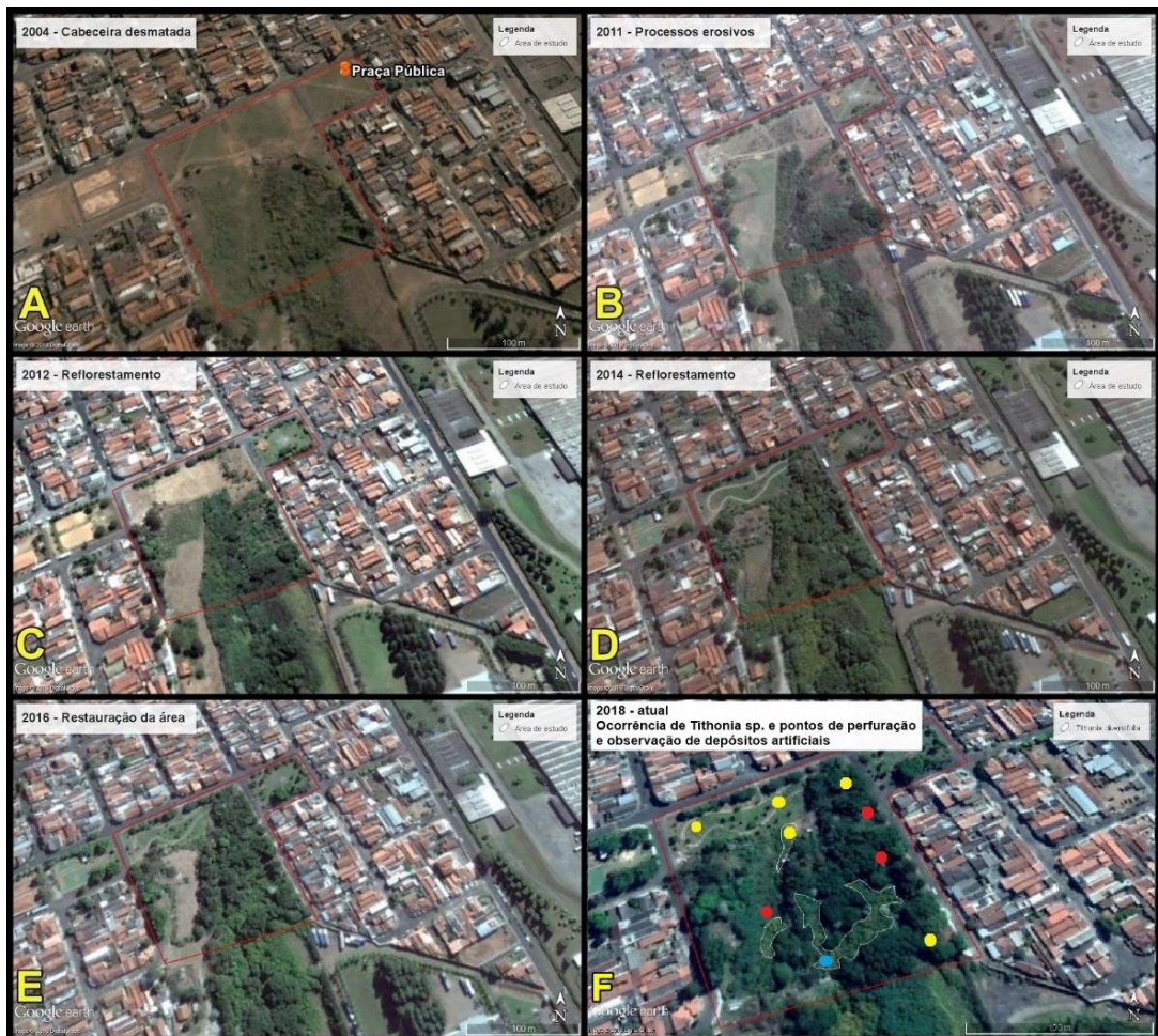
Figura 1 - Evolução da paisagem da área de estudo. A: 2004, cabeceira desmatada; B: 2011, processo erosivo; C: 2012, reflorestamento; D: 2014, evolução do reflorestamento; E: 2016, restauração da área; F: 2018, condição atual; área circutada indica ocorrência de Tithonia diversifolia (cor amarelada na vegetação na época de floração); pontos amarelos - ocorrência de depósitos já incorporados ao solo; pontos vermelhos - locais onde foi observada a deposição de resíduos de origem antropogênica; ponto azul - localização do perfil exposto. Org.: Autores (2018).

indicativo de onde ocorre um solo tecnogênico, uma vez que a planta ocupa solos degradados. Essa análise comparativa também possibilita identificar as áreas em que a vegetação se restabeleceu com sucesso no processo de recuperação da área.